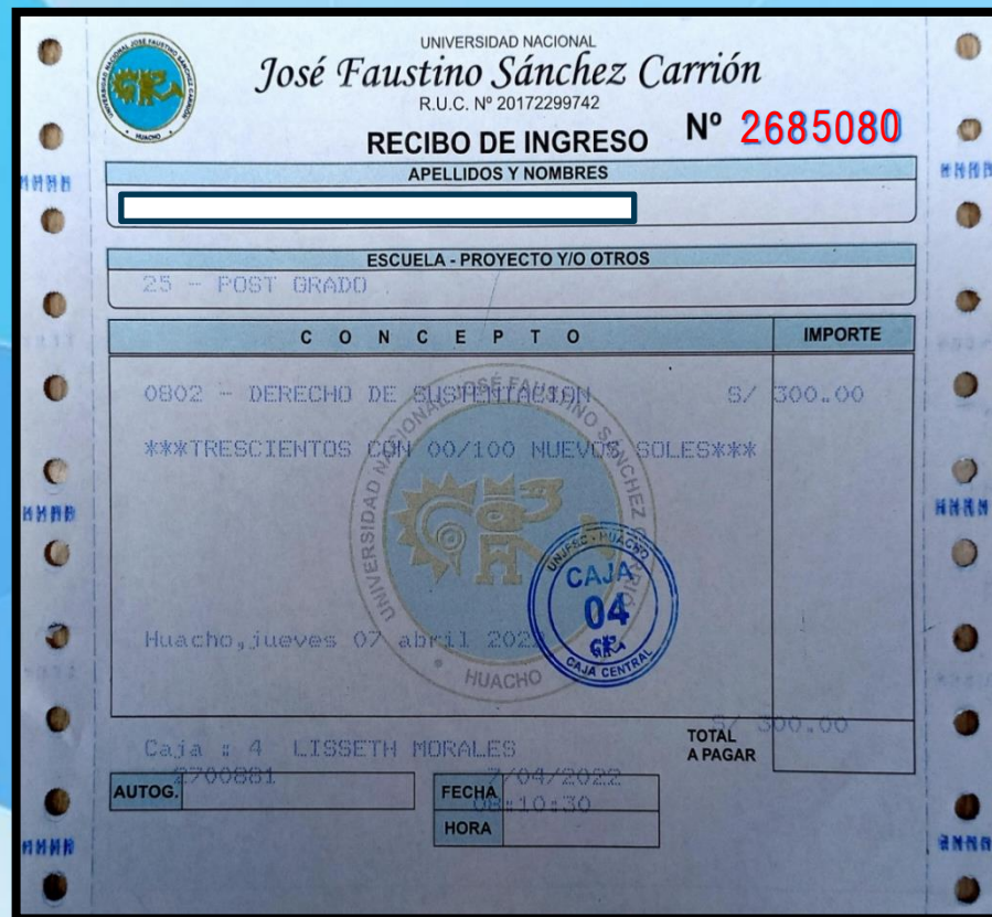
MODELO DE RECIBO DE LA CAJA CENTRAL DE LA UNJFSC